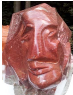
Afbeelding 2. Beeld door Dienneke van Silfhout (privébezit).

Raadsels over de ontwikkeling van de mensheid houden onze gemoederen nog altijd bezig. Ondanks dat we tegenwoordig veel weten en veel wetenschappelijke kennis tot onze beschikking hebben, blijven veel vragen onbeantwoord. Gelukkig vinden we nog steeds mythische, religieuze, symbolische en stoffelijke sporen, die na bestudering antwoorden opleveren over de ontwikkeling van de mensheid. Naarmate de belangstelling voor onze oude bronnen toeneemt, schijnt er meer licht op de oude raadsels uit het verleden.