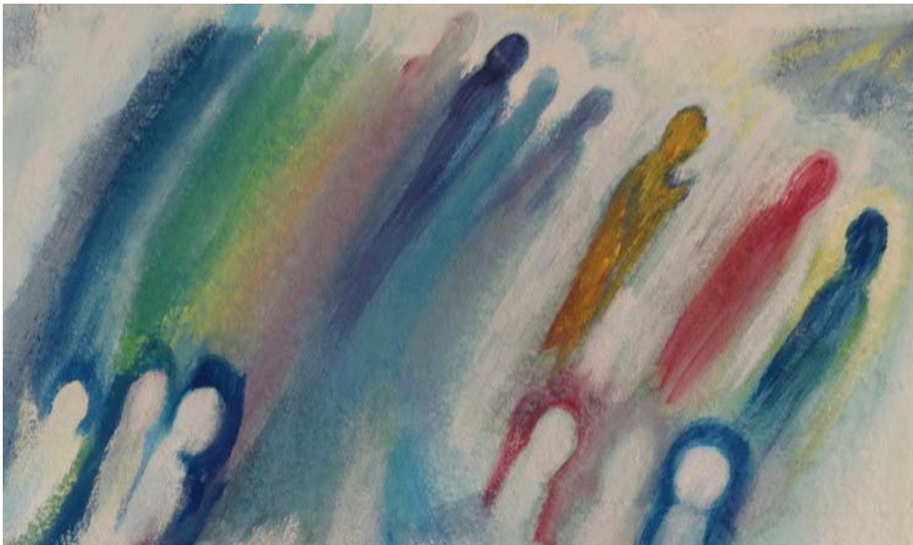
Afbeelding 1. De Boodschapper (schilderij door Lenny van Genderen).